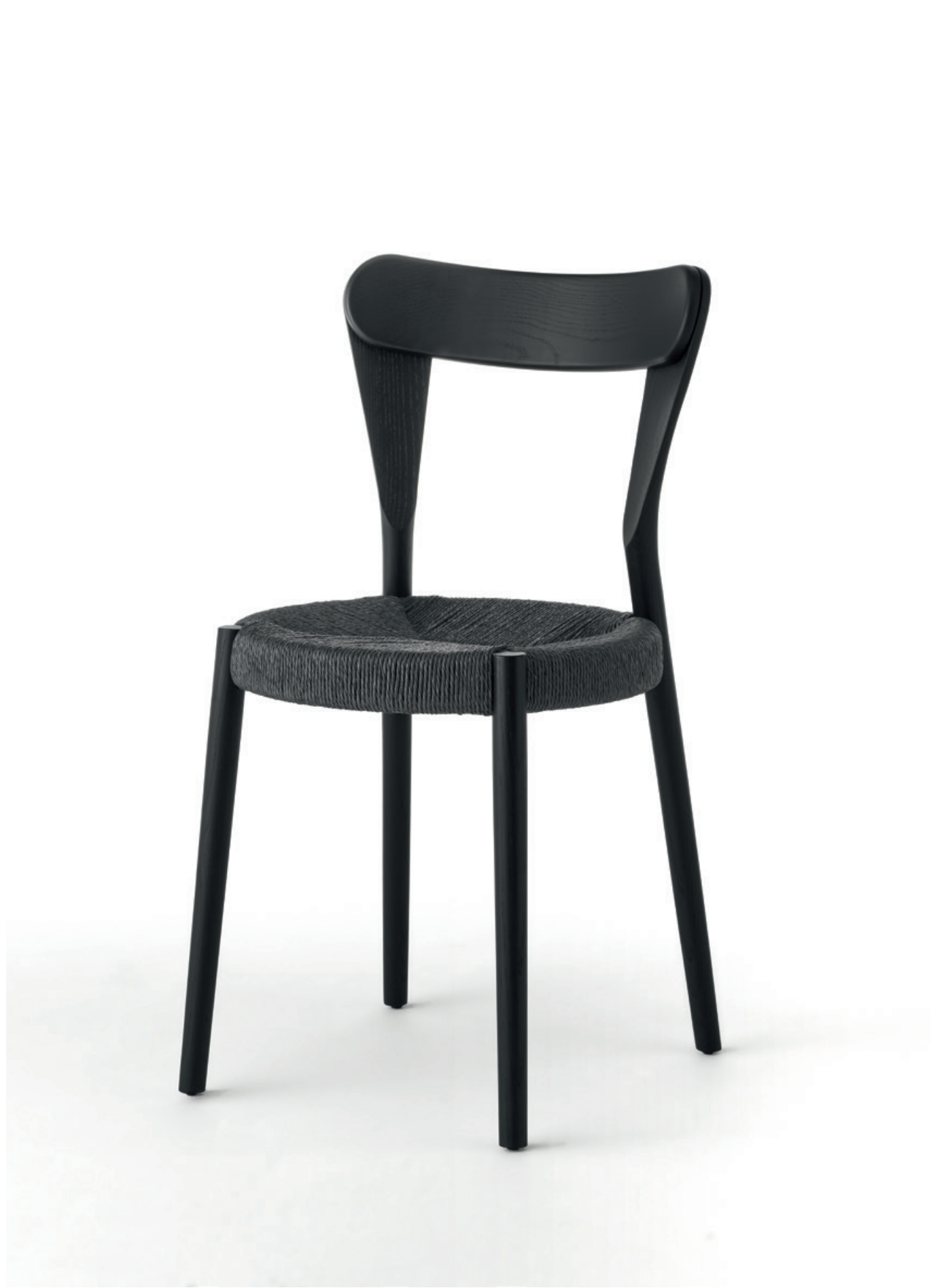
Pagaia Chair Black Ash