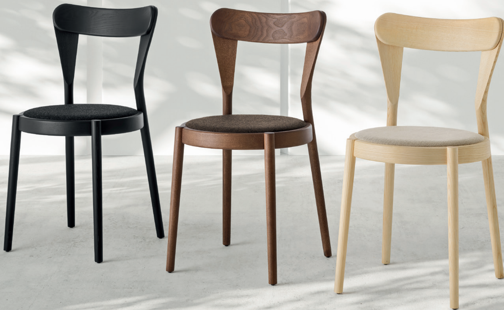
Pagaia Chair Black Ash, Walnut Ash, Natural Ash