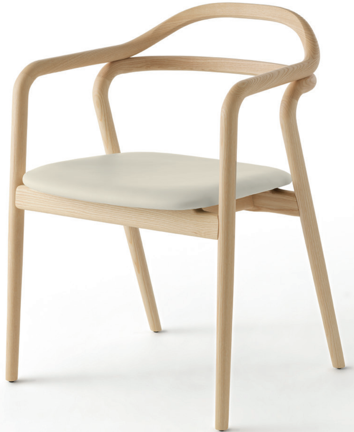
Tacta Armchair Natural Oak