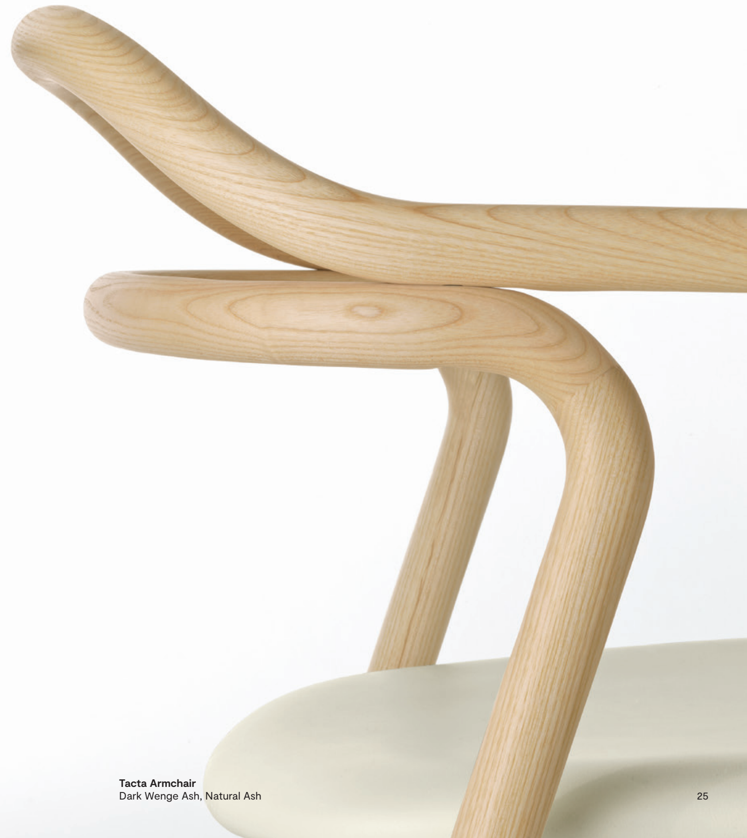
Tacta Armchair Dark Wenge Ash, Natural Ash