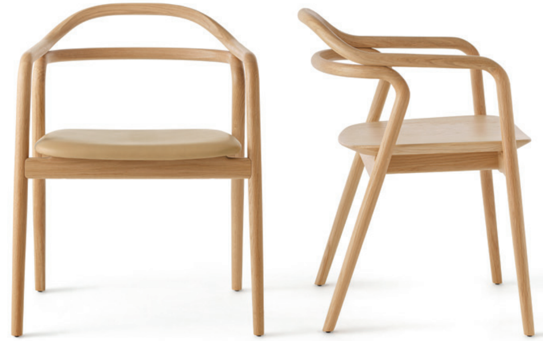
Tacta Armchair Natural Oak