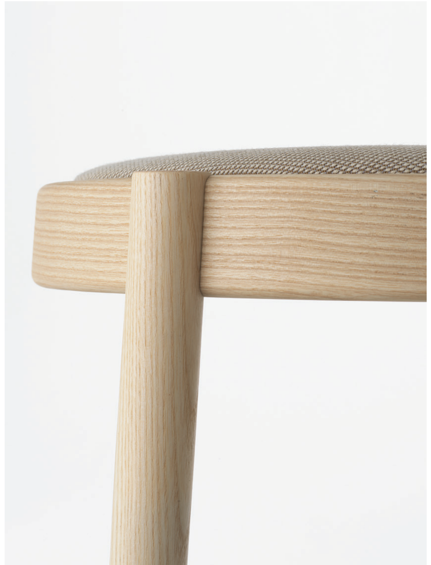
Pagaia Chair Natural Ash