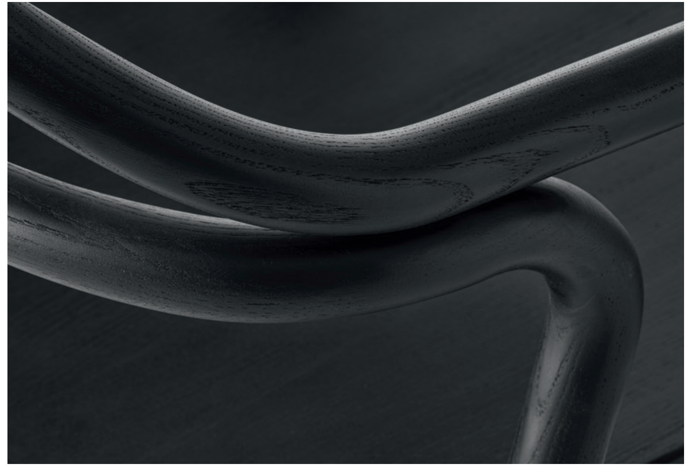
Tacta Armchair Black Ash