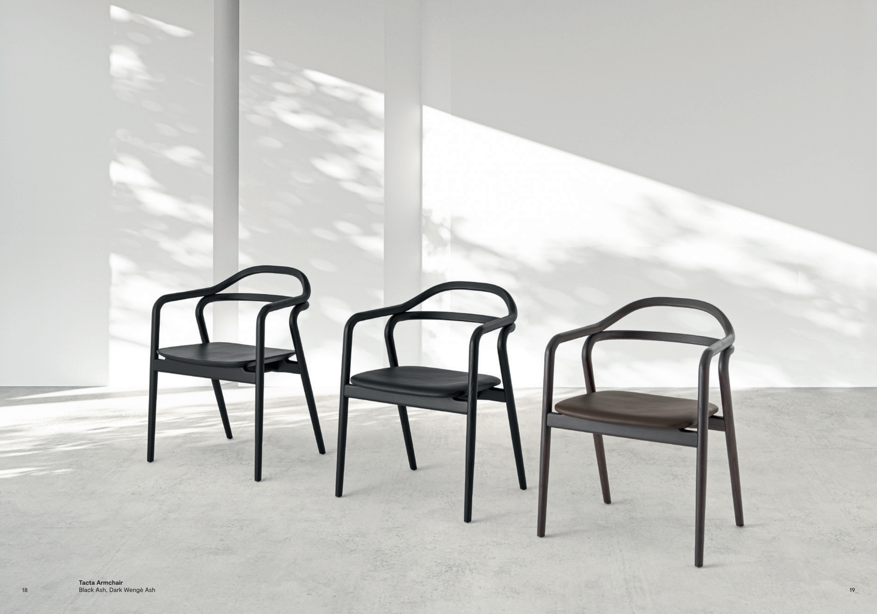
Tacta Armchair Black Ash, Dark Wengè Ash