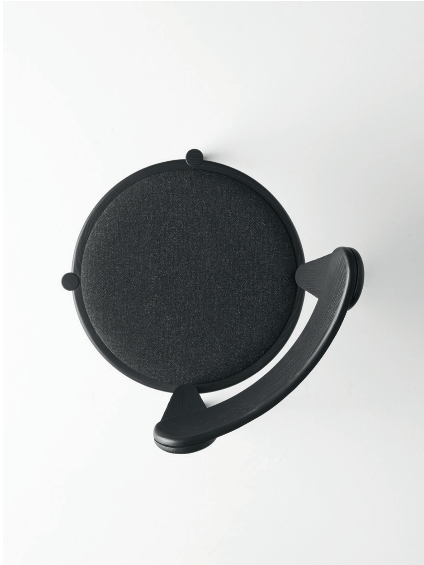
Pagaia Chair Black Ash