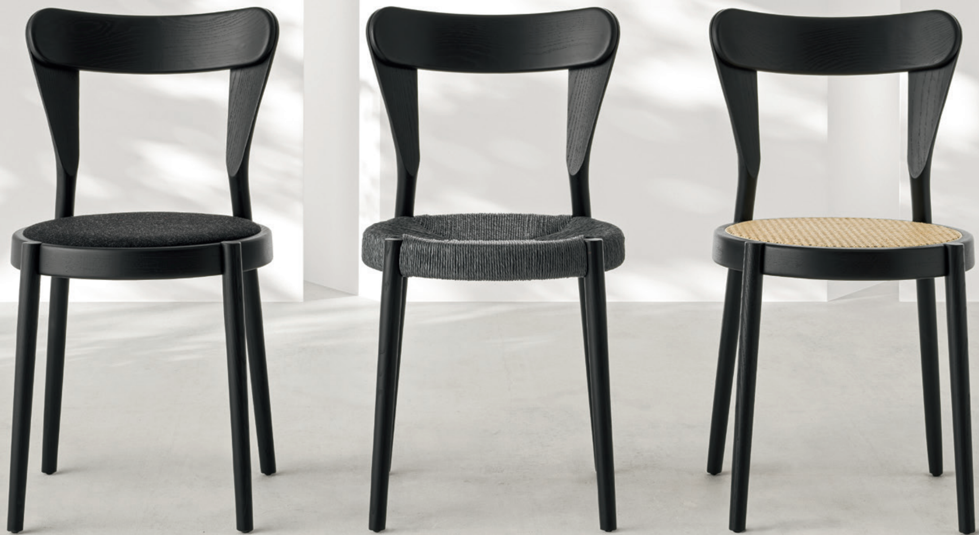
Pagaia Chair Black Ash