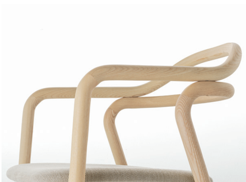
Tacta Armchair Natural Ash