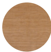
Natural Oak Rovere Naturale