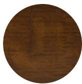
Walnut Oak Rovere Noce