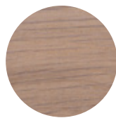
White Oak Rovere Bianco