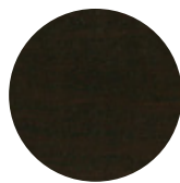
Dark Wengè Oak / Rovere Dark Wengè