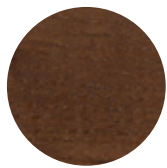
Walnut Ash Frassino Noce