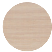
White Ash Frassino Bianco