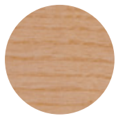
Natural Ash Frassino Naturale