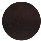
Dark Wenge Ash / Frassino Dark Wengè