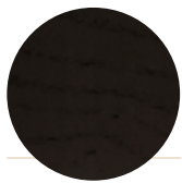
Black Ash Frassino Nero