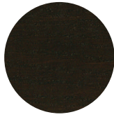
Dark Wengé Oak / Rovere Dark Wengé