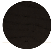
Black Ash Frassino Nero