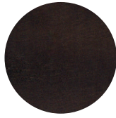
Dark Wengé Ash / Frassino Dark Wengé