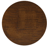
Walnut Oak Rovere Noce