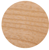
Natural Ash Frassino Naturale