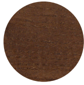
Walnut Ash Frassino Noce