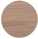
White Oak Rovere Bianco