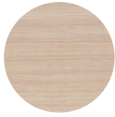
White Ash Frassino Bianco