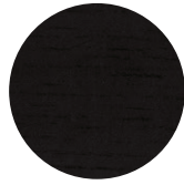
Black Oak Rovere Nero