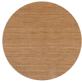
Natural Oak Rovere Naturale